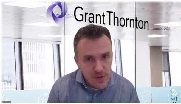
transformáci analyzovať - štatistické údaje a nové segmenty