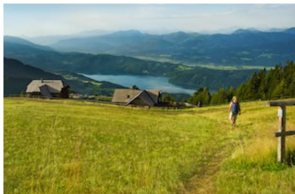
Alpe Adria Trail

5 Sterne oder doch eine der vielen Alternativen: Kärntens Unterkünfte. Egal ob Luxus-Hotel, Urlaub am Bauernhof, Chalet, Privatvermieter oder Campingplatz. Bei der Auswahl der Unterkünfte in Kärnten bleiben keine Wünsche offen. Zu den ganz besonderen zählen eine Bootshaus Suite am Millstätter See, ein Baumhaus in Althofen, Biwaks am Millstätter See, eine Sunset-Suite am Wörthersee, Erdhäuser am Weissensee oder eine Hochzeiterhütte in den Nockbergen. Mehr zu außergewöhnlichen Unterkünften in Kärnten